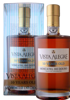
Vista Alegre 10Y old Moscatel do Douro