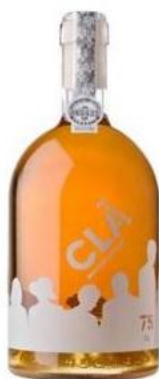
Quinta Nova Clã Moscatel do Douro